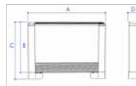
ATTACCHI STANDARD LATO SINISTRO

QUOTE PER TUTTE LE TAGLIE: B = 670mm - C = 745mm