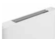
ALETTA NEMO APERTA

Il flap è orientabile manualmente per ottenere la migliore direzione di uscita dell'aria. Anche a flap chiusi, Nemo può funzionare alla velocità super silence, offrendo una superficie liscia senza soluzione di continuità.