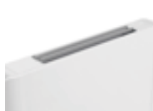
ALETTA NEMO APERTA

Il flap è orientabile manualmente per ottenere la migliore direzione di uscita dell'aria. Anche a flap chiusi, Nemo può funzionare alla velocità super silence, offrendo una superficie liscia senza soluzione di continuità.