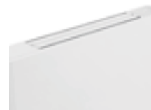
ALETTA NEMO CHIUSA